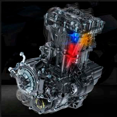
MOTOR 350 CC