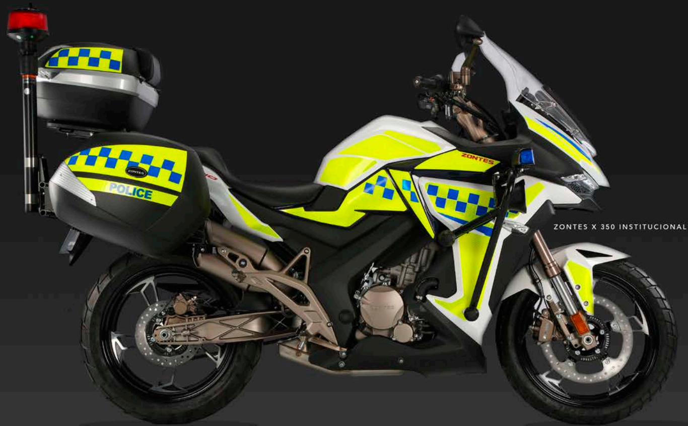
ZONTES X 350 INSTITUCIONAL