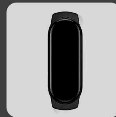
LLAVE DE PRESENCIA