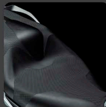
ASIEN TO DE GEL